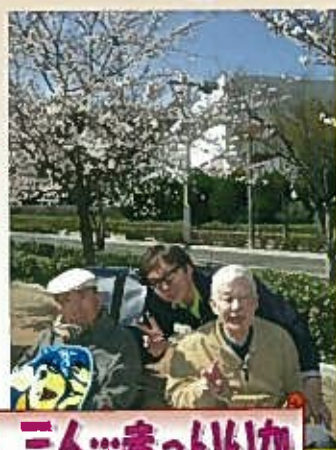
男、三人…まっぴりか