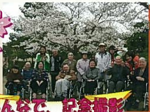
みんなで、記念撮影 ハイ、チーズ！