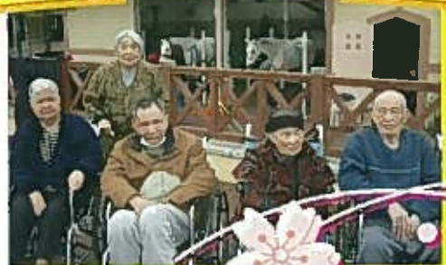
競馬場で白馬をみちゃいました!