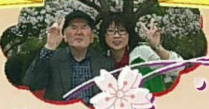
天気もいいし ピースもききました!!