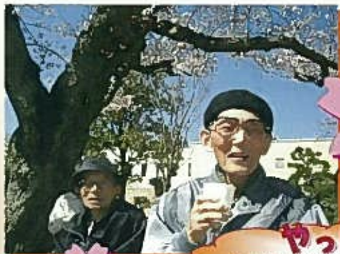
やっぱり お酒がいろいろあ～

桜の季節がやって来ました！ 今年の通所のお花見は、4月4日から8日にグループにわかれて、 金比羅公園、小倉競馬場に出かけました。 お天気にめぐまれ、最高のお花見ができました。 みんなで、コーヒーとおやつを美味しくいただきました！