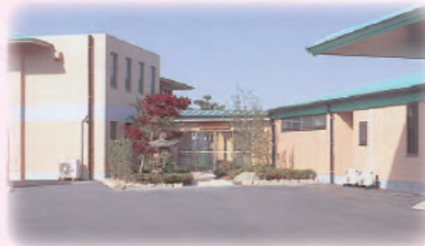
▲ グループホームみどり

「楽しい老後を過ごしたい」・「外出の機会が少なくなった」・などと感じている方に、入浴・食事の提供とその介護、生活などの相談、健康チェックや機能訓練などを行います。個別レクリエーションを通じて、利用者様が交流を深める憩いの場としての役割も果たしています。普段介護にあたるご家族の負担も軽くなり、自分の時間を確保するためにもご利用になれます。