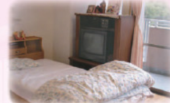
▲ 温かみのある居室