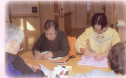
▲ 手芸 午後のひととき