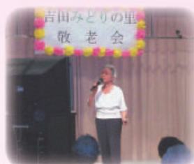
▲ カラオケ教室発表会